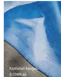
Kastunut kangas. Ei DWR:ää

Kastuminen vähentää vaateen hengittävyttä, mukavuutta ja suorituskykyä, ja saa sen tuntumaan kylmältä ja märältä. Toisin kuin tavalliset pesuaineet, Granger's-puhdistusaineet poistavat likaa, öljyjä ja tahroja heikentämättä kankaan vettähylkivyyttä – palauttaen sen alkuperäisen suorituskyvyn.